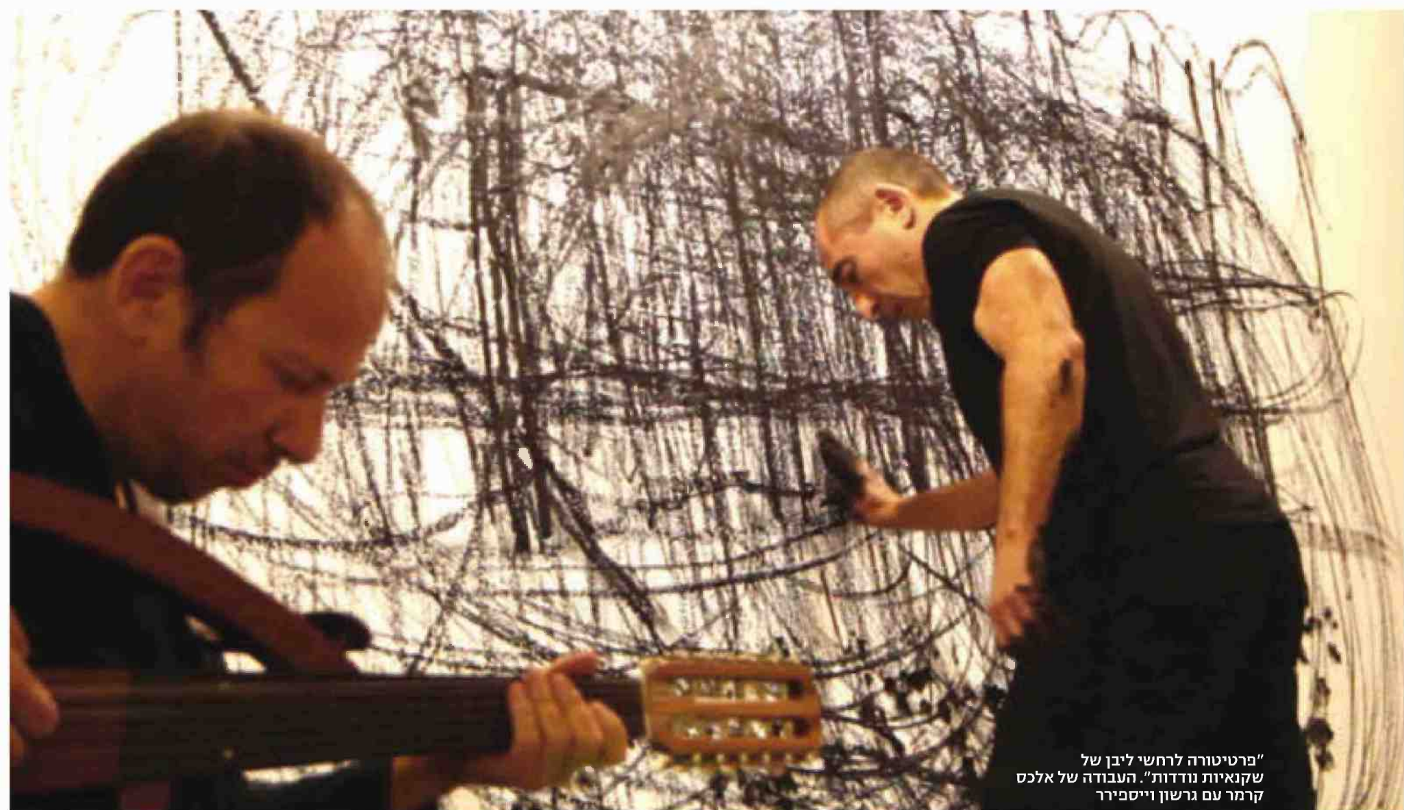
"פרטיטורה לרחשי ליבן של שקנאיות נודדות". העבודה של אלכס קרמר עם גרשון וייספירר