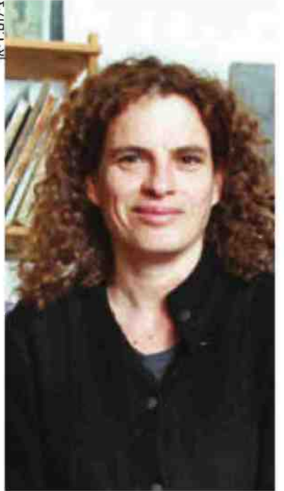
להמציא שפה. תרצה פרוינד